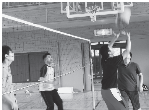
優勝 青年会チーム 準優勝 ボブチーム

空気抵抗で独特の変化をするボールに戸惑うチーム、うまく利用してポイントを稼いだチームとありましたが、今年は昨年優勝したテクニクスの長田屋チーム