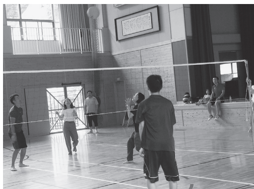
三位 長田屋チーム 四位 たけろうチーム