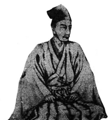
石斎筆 原信好画像