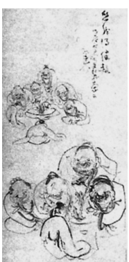
原 蓬山作 掛軸